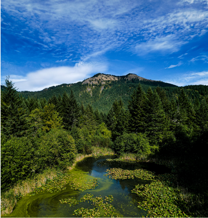
Como se ve aquí, la Reserva de Alashik se encuentra en la ladera occidental de Dog Mountain. Si la propiedad hubiera sido talada a ras del suelo y minada, la escorrentía minera, cargada de sedimentos, podría haber devastado los frágiles ecosistemas de Turtle Haven, que se encuentra justo debajo de Alashik.