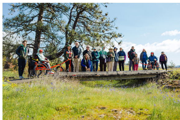
El 13 de abril, en el Refugio Nacional de Vida Silvestre del Lago Steigerwald, disfrutamos de un día accesible de la magia de la migración de aves primaverales: avistamos águilas, garzas y martines pescadores a lo largo de un sendero rico en vida de humedales restaurados.