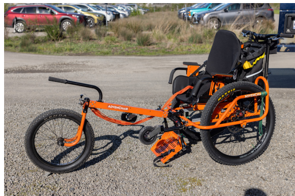
En la imagen, la AdvenChair es una silla de ruedas todoterreno impulsada por el hombre, diseñada para que personas con movilidad reducida puedan disfrutar de forma segura de la serenidad y la grandeza de la naturaleza con familiares y amigos.

Visita gorgefriends.org/outings para explorar futuras oportunidades.