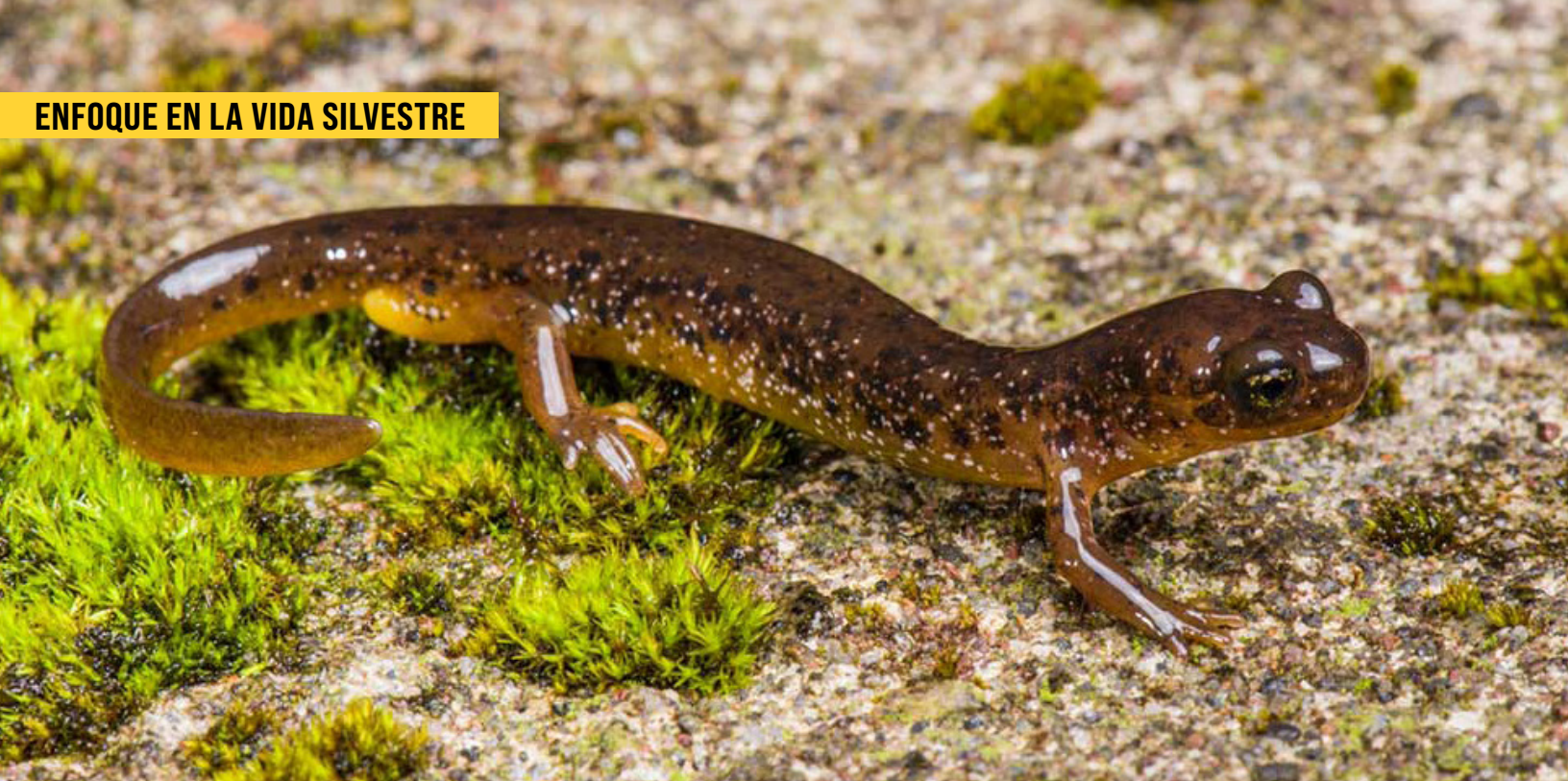
Foto: Salamandra torrente de la cascada