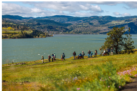
AdvenChairs hizo accesibles las flores de primavera a todos durante nuestra caminata de flores silvestres del 12 de abril en Catherine Creek. Los participantes recorrieron el Sendero de Acceso Universal rodeados de camas, lupinos y vistas panorámicas del Gorge.