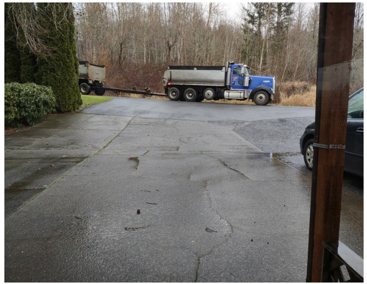
Aunque la minería se ha detenido en la propiedad de Zimmerly, continúan nuevas infracciones, como la construcción de carreteras sin permiso (izquierda) y el vertido de material de relleno en la propiedad (derecha).

rechazarla dos veces, el Condado de Clark rechazó firmemente los riesgos ocultos que conllevaría esta vía.